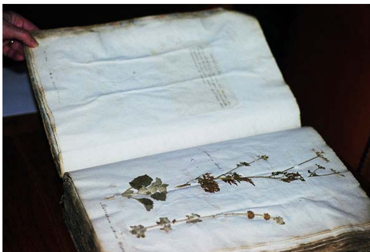
Illustration n° 4 : Vue d'une page

Les spécimens sont principalement fixés par des bandes de papier blanc irrégulières, mais les éléments trop larges peuvent être collés directement.