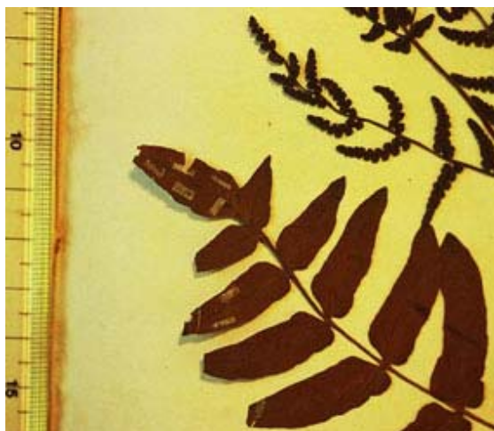
Illustration n° 8 : Vue de détail de feuilles reconstituées, avant retouche sur les consolidations en papier japonais