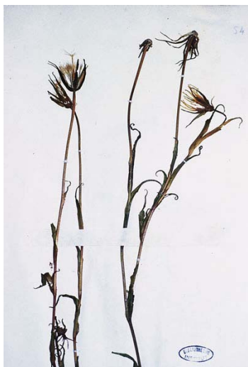
Illustration n° 9 : Vue de détail d'une plante reconstituée et refixée