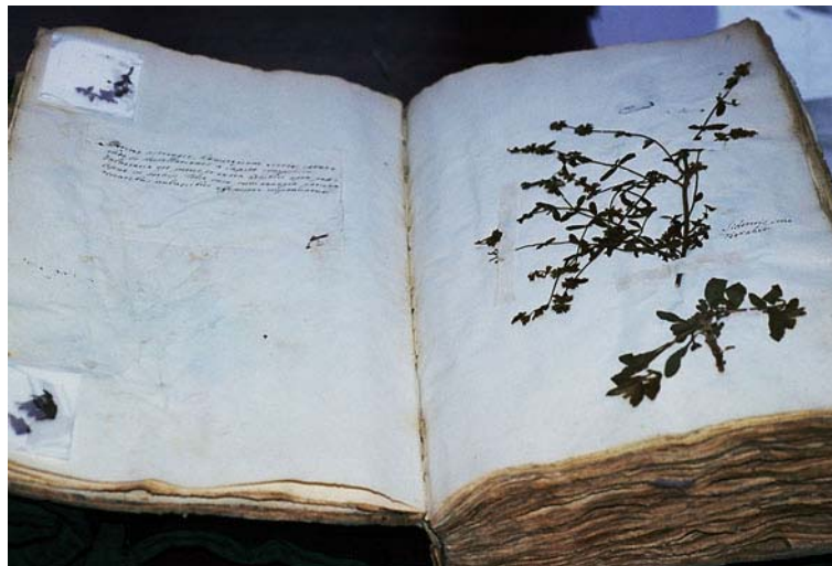
Illustration n° 12 : Vue d'un volume ouvert après intervention et fixation de pochettes

Après découpage, une bande de papier japonais est fixée le long du bord supérieur avec de la colle vinylique. Cette bande va permettre la fixation sur les pages de papier avec de la colle d'amidon.