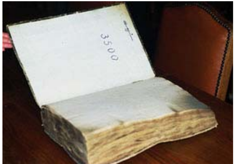
Illustration n° 2 : Vue du volume ouvert

Le deuxième, répertorié sous la cote 3500, possède à peu près le même nombre de pages et les mêmes dimensions, mais il est anonyme.