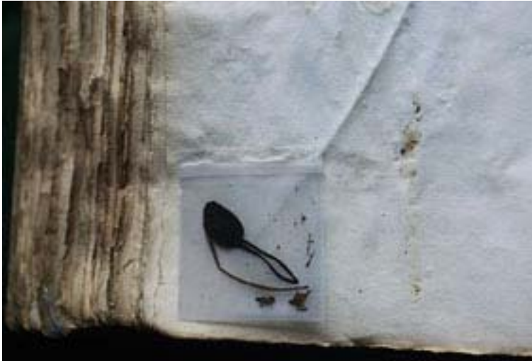
Illustrations n° 10 & 11 : Vues des 2 tailles de pochette avec fragments à l'intérieur

Nous avons proposé d'utiliser des pochettes de polyester de qualité conservation. Elles sont découpées dans de feuilles d'album pour diapositives, négatifs ou documents graphiques. Nous avons choisi 2 tailles qui correspondaient aux fragments ( 52 x 57 et 75 x 112 cm) 3 .